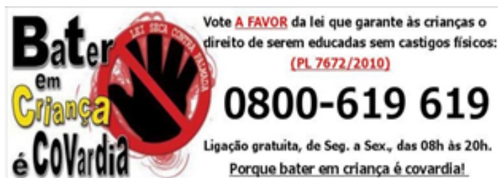
Imagem do grupo de discussão "Bater em criança é covardia".

Você também pode dar sua opinião através da Central Interativa da Câmara dos Deputados.