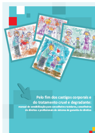
Pelo fim dos castigos corporais e do tratamento cruel e degradante: manual de sensibilização para conselheiros tutelares, conselheiros de direitos e profissionais do sistema de garantia de direitos

Exemplo prático de participação infantil. O roteiro foi criado a partir dos desejos, sonhos, ideias e senso crítico das crianças. A equipe técnica propôs soluções gráficas, narrativas e de continuidade a partir das ideias elaboradas por elas. No vídeo, as crianças mostram que são capazes de apresentar alternativas, reconhecer a importância de regras e limites e contribuir para a solução pacífica de conflitos.