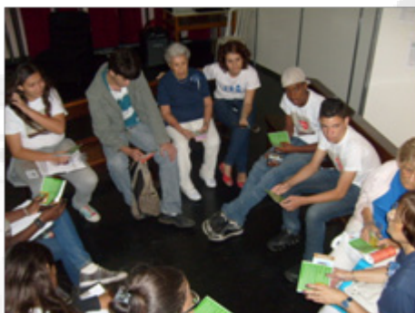
Roda de conversa sobre castigos corporais e tratamento humilhante conduzida por adolescentes que participam do eixo infantojuvenil da RNBE durante a EXPOUVA 2011.

No período de 21 a 22 de setembro participamos da EXPOUVA 2011 – Dia da Responsabilidade Social do Ensino Superior Particular promovido pela Universidade Veiga de Almeida no Rio de Janeiro. A Rede Não Bata Eduque, CEDECA-RJ e o Instituto Noos compartilharam um stand na área destinada às Organizações Não Governamentais.