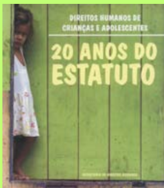
"Direitos Humanos de Crianças e Adolescentes – 20 anos do Estatuto", da Secretaria de Direitos Humanos.

Em dezembro de 2010 foram lançadas duas publicações importantes para a defesa dos direitos da criança e do adolescentes são elas: