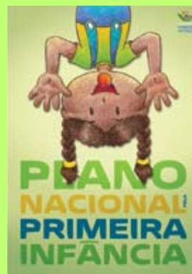
"Plano Nacional pela Primeira Infância", da Rede Nacional Primeira Infância.*

*A versão resumida pode ser obtida através do link : http://primeirainfancia.org.br/wp-content/uploads/PPNI-resumido.pdf